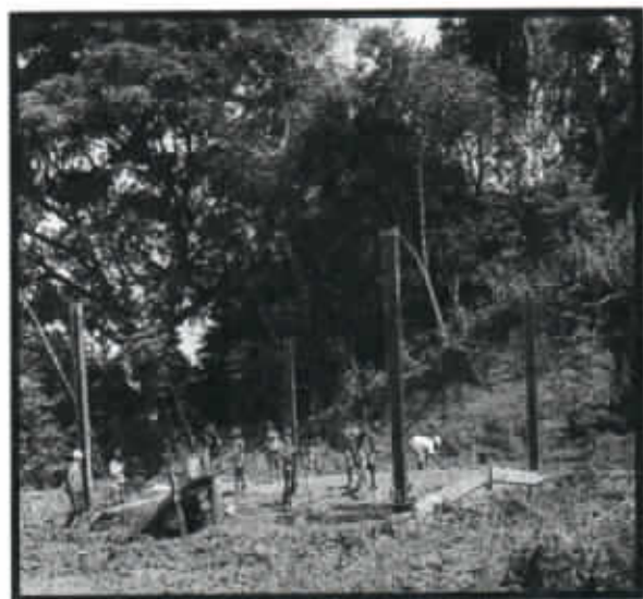
IMAGEN N°9 NUEVA GALERA PORCINA