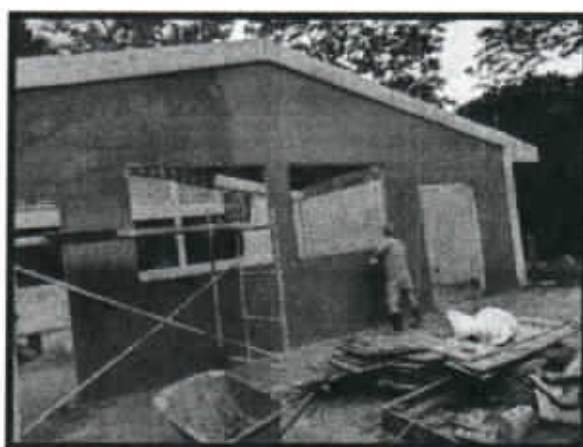
IMAGEN N°2 – NUEVO DEPOSITO 5