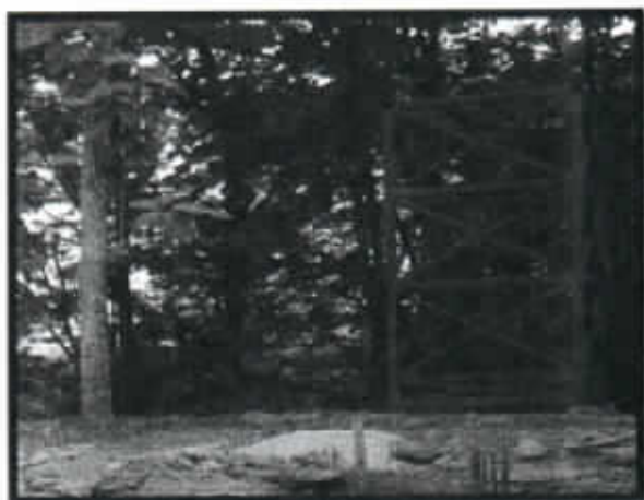
IMAGEN N°7 BASE DE TANQUE DE AGUA