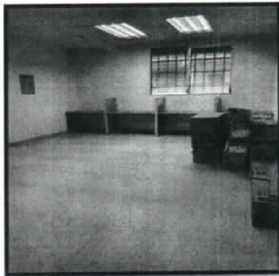
IMAGEN N°10 REMODELACIÓN PABELLÓN N°2 (SALÓN DE PROFESORES)

Basado en lo anterior, después de las consultas con las partes interesadas (Empresa Contratista y el Ministerio de Educación), las evaluaciones y verificaciones de la nota presentada por el contratista, el Cronograma de Obra y el Expediente Administrativo del contrato en mención, se considera viable la solicitud del contratista, por lo que el Inspector de Obra y el Jefe del Departamento de Ejecución e Inspección; aprueban la prórroga de ciento veinte (120) días calendario, adicionales al plazo de cumplimiento al contrato en mención." (sic);