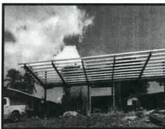
IMAGEN N°4 – ADECUACIÓN PLAZA DE ENTRADA