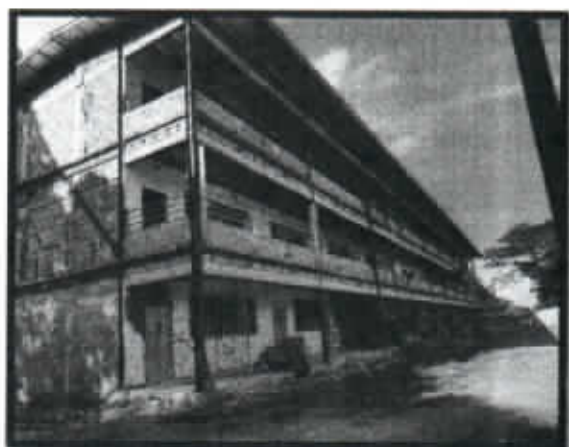
IMAGEN N°1 – NUEVO PABELLÓN 4

Adjuntamos imágenes del avance del físico como constancia de los trabajos realizados por la Empresa CONSORCIO COMGER para el proyecto del contrato en mención: