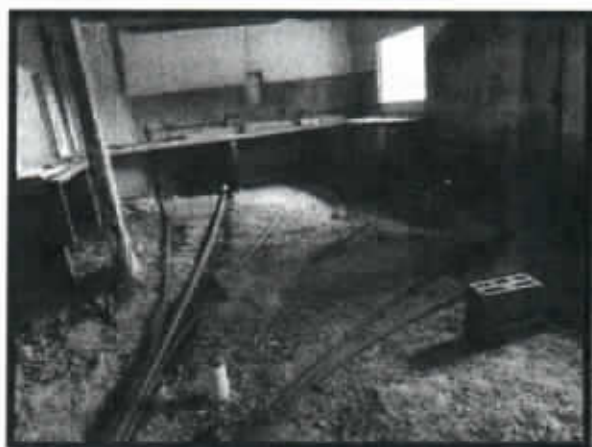
IMAGEN N°3 – REMODELACIÓN KIOSCO