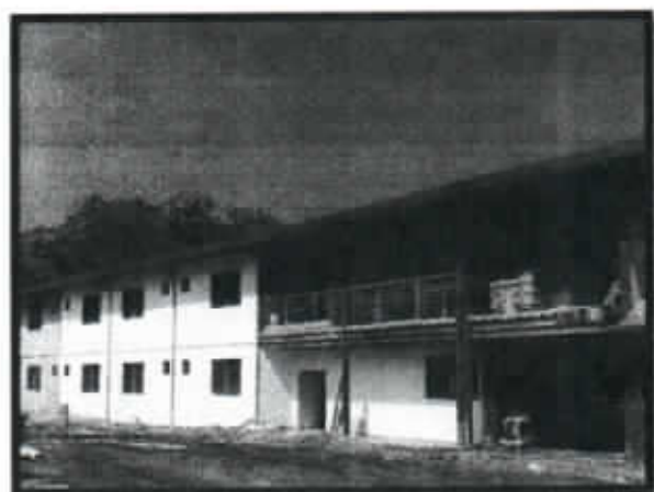
IMAGEN N°5 – NUEVO INTERNADO