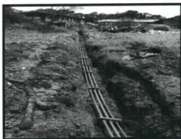
IMAGEN N°8 VIADUCTOS INTERNOS