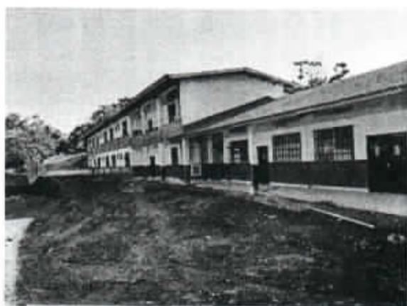
IMAGEN N°5 – NUEVO INTERNADO

Basado en lo anterior, después de las consultas con las partes interesadas (Empresa Contratista y el Ministerio de Educación), las evaluaciones y verificaciones de la nota presentada por el contratista, el cronograma de obra y el expediente administrativo del contrato en mención, se considera viable la solicitud del contratista, por lo que el Inspector de Obra y el Jefe del Departamento de Ejecución e Inspección; viabilizan prórroga de ciento ochenta (180) días calendario, adicionales al plazo de cumplimiento al contrato en mención.”(sic);