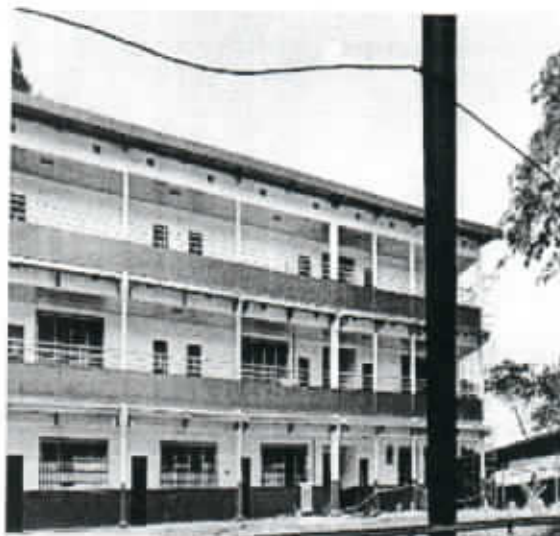
IMAGEN N°4 – PABELLON 4